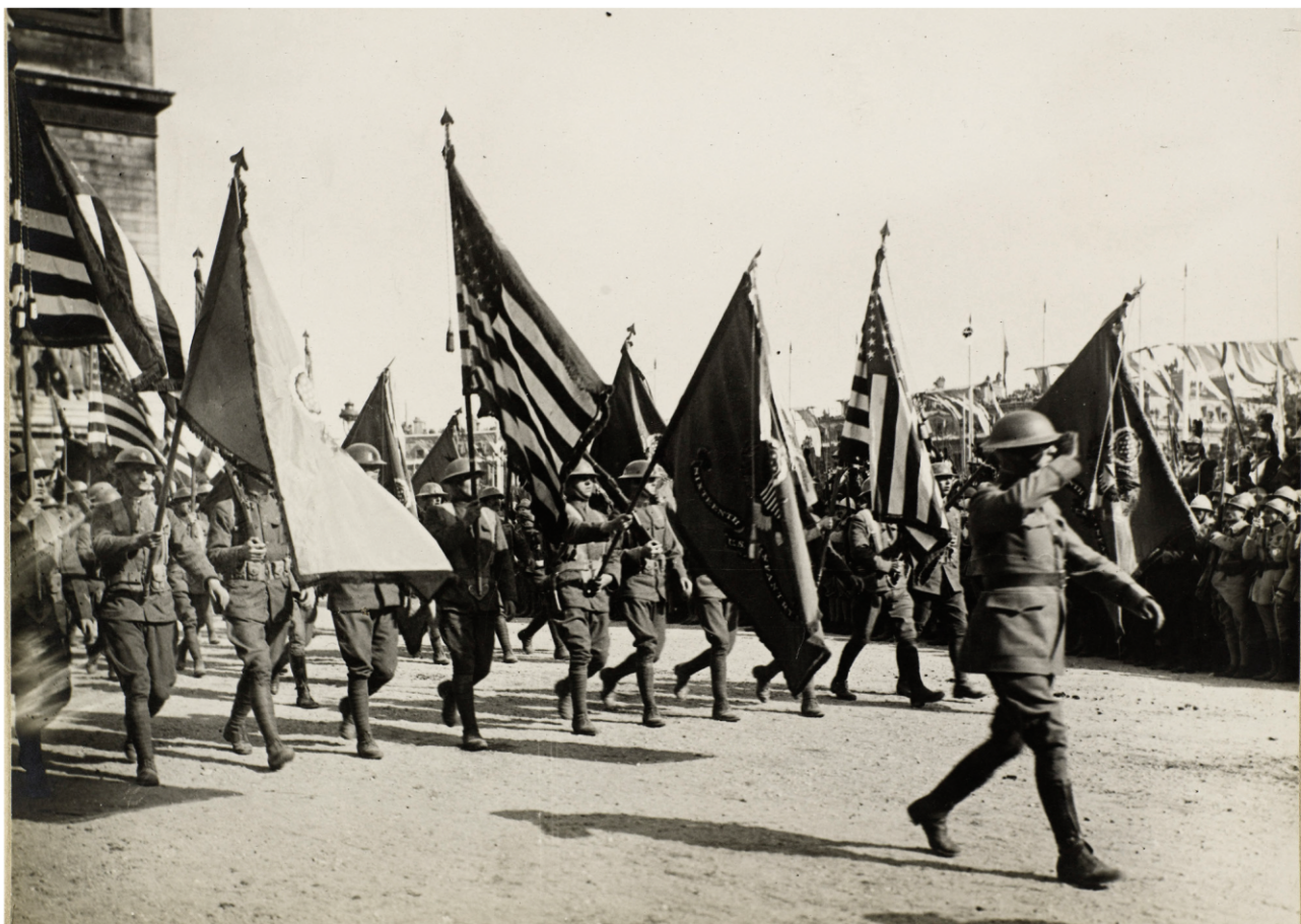
Défilé du 14 juillet 1919, soldats américains, avenue des Champs-Élysées, place de l'Etoile, 8 e arrondissement, Paris. © Lansiaux, Charles Joseph Antoine, Photographe. Tirage 17.2 x 23.2 cm, au gélatino-bromure d'argent. CCO Paris Musées / Musée Carnavalet - Histoire de Paris

Cette ferveur va perdurer bien au-delà du conflit. En 1927, à l'occasion du 10 e anniversaire de l'intervention américaine, l'American Legion choisit de tenir son congrès annuel à Paris. Près de 30 000 anciens combattants annoncent leur participation. Devant de tels chiffres, les autorités décident d'organiser une manifestation officielle. Son ampleur dépassera toutes les prévisions. Le 19 septembre, devant plus d'un million de Parisiens, chiffre considérable, les vétérans défilent pendant quatre heures depuis la statue de Washington, place d'Iéna, jusqu'à Notre-Dame, en empruntant les Champs-Élysées où, suprême honneur, ils sont autorisés à passer sous l'Arc de Triomphe.