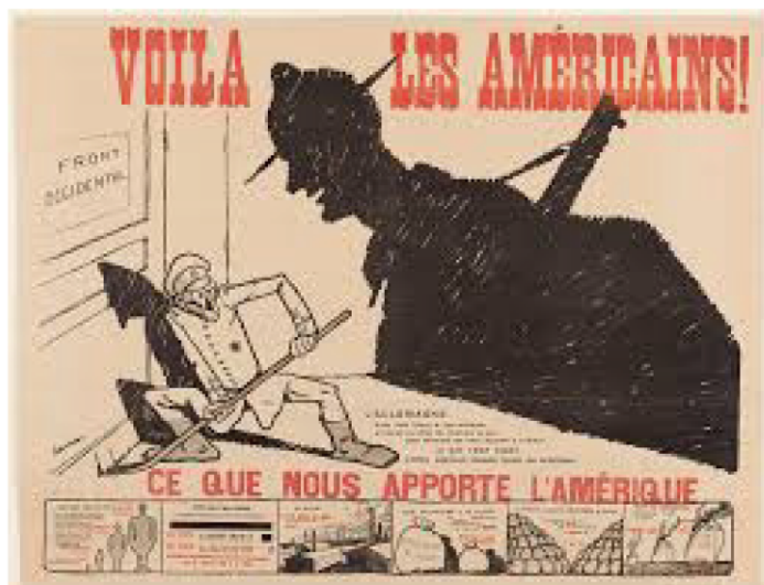
Affiche de 50x65 cm, illustrée par Charles Saunier, dessinateur Berger-Levrault.

d'après-midi. C'est une marée humaine qui l'attend sur son parcours entre la gare du Nord et la place de la Concorde. Aux fenêtres et sur les toits, des Parisiens en liesse couvrent de fleurs le cortège de voitures dans lequel la délégation