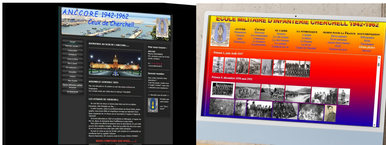
Les deux sites internet du patrimoine immatériel des anciens de Cherchell : www.emicherchell.com et www.anccore.fr de l'association nationale des Cadres de Cherchell, Officiers de Réserve et Elèves. (ANCCORE)