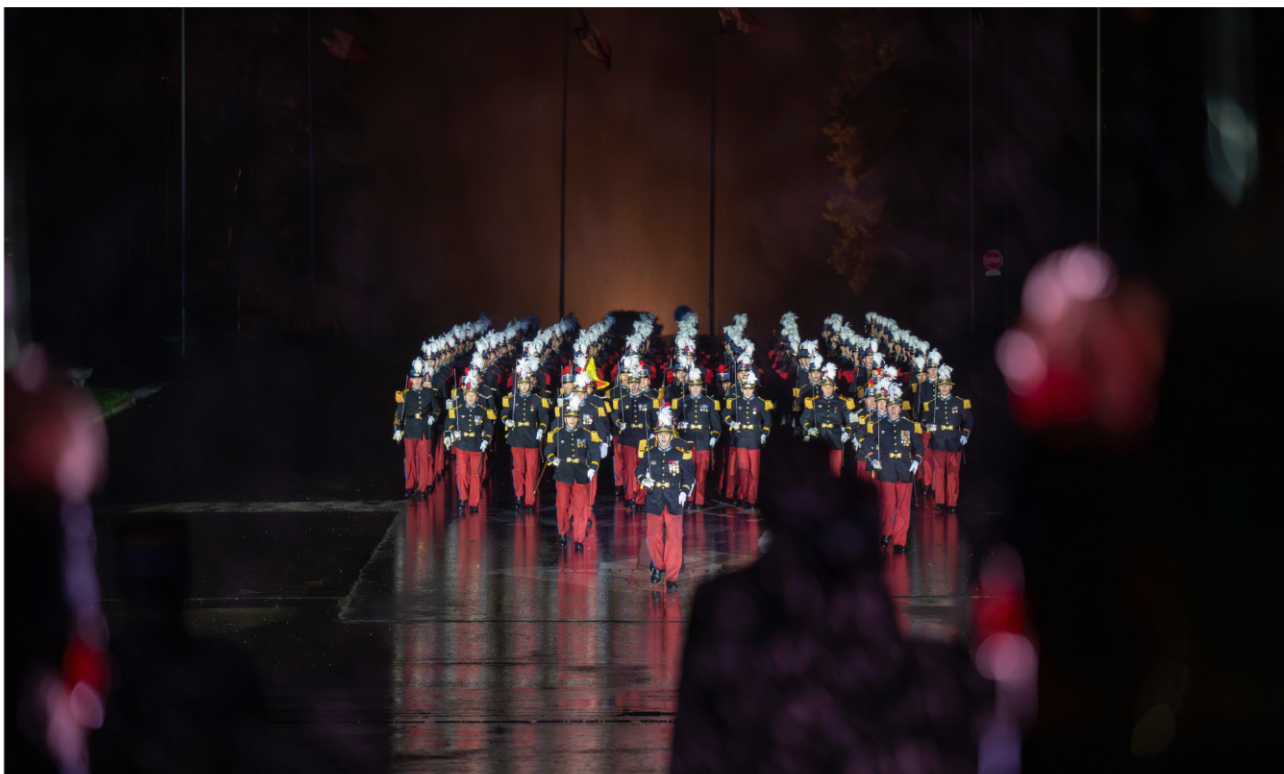
Les OST défilent avec l'ESM3 et arborent les fameuses épaulettes dorées.

Cette séquence réussie est un beau moment solennel, marquant un premier rendez-vous avec les familles avant le baptême de promotion très attendu l'été prochain.